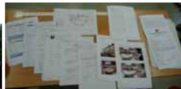
Povinná dokumentace k projektu