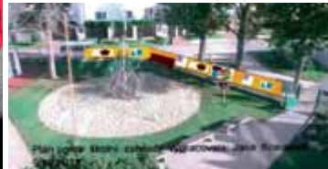
3D plánek – žáci