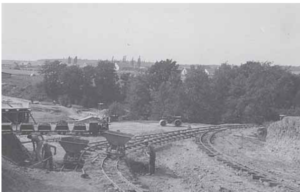
Stavební drážka na tělese dálnice u Průhonic, pohled přes Botič k Újezdu. Foto archiv T. Jandy, 1940

– V sobotu 30. 5. odpoledne Vás zveme do Újezdu na prezentaci historických automobilů Českého veterán klubu Autoklubu ČR. K výročí dále vydáváme pamětní list, který můžete získat na jednotlivých akcích.