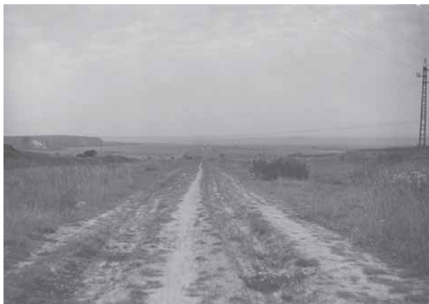
Dálniční těleso mezi Šeberovem a Kateřinkami, pohled od současného najezdu Chodov – Šeberov k Průhonicím. Foto J. Neuvirt, 1965