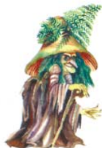
13. Houbábinka nazelenalá

Velké oslavy 100. výročí školy se chystají pokračovat v září. Chtěli bychom uspořádat výstavu fotografií, různých školních potřeb z dřívějších let až po současnost. Předběžně se obracím