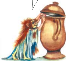
21. Nosatka medomilná

zboží. Velice mne těší, když potkávám maminky a slyším od nich chválu, že se jim náš jarmark velmi líbil a že se těší na