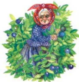
3. Bábřinka borůvková

Hned po návratu nás čekaly přípravy na „Velikonoční jarmark“. Děti vyráběly nejruznější velikonoční dekorace, které si bylo možno zakoupit, při jarmarku jsme se mohli naučit plést pomlázku, či zdobit kraslice voskem, zakoupit květiny, proutěné zboží. Velice mne těší, když potkávám maminky a slyším od nich chválu, že se jim náš jarmark velmi líbil a že se těší na