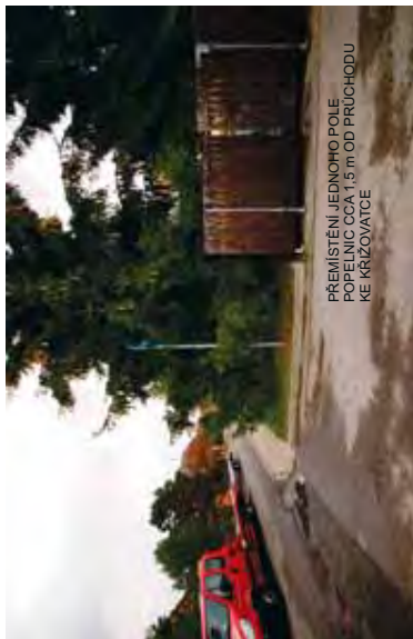
PREMÍSTĚNÍ JEDNOHO POLE POPELNIC ČCA 1,5 m OD PRŮCHODU KE KRIZOVATCE