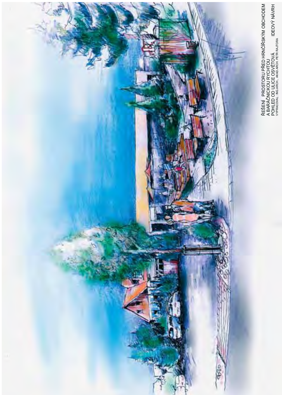
ŘEŠENÍ PROSTORU PŘED HRNČÍŘSKÝM OBCHODEM A BARÁČNICKOU RYCHTOU POHLED OD ULICE OSVĚTOVÁ IDEOVÝ NÁVRH VYPRACOVAL: ING.ARCH. AKAD.ARCH. PETR BALTOŘA