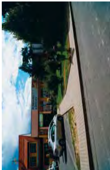
ŘEŠENÍ PŘED HRNČÍŘSKÝM OBCHODEM A BARAČNICKOU RYCHTOU FOTODOKUMENTACE 10.2015