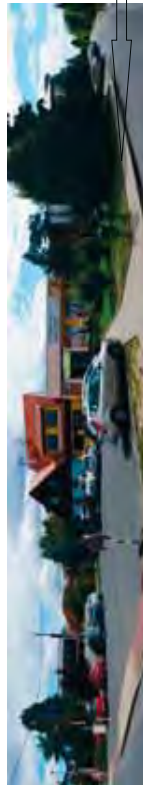
PLOCHA PARKOVIŠTĚ PONECHÁNA PRO POŘÁDÁNÍ AKČÍ